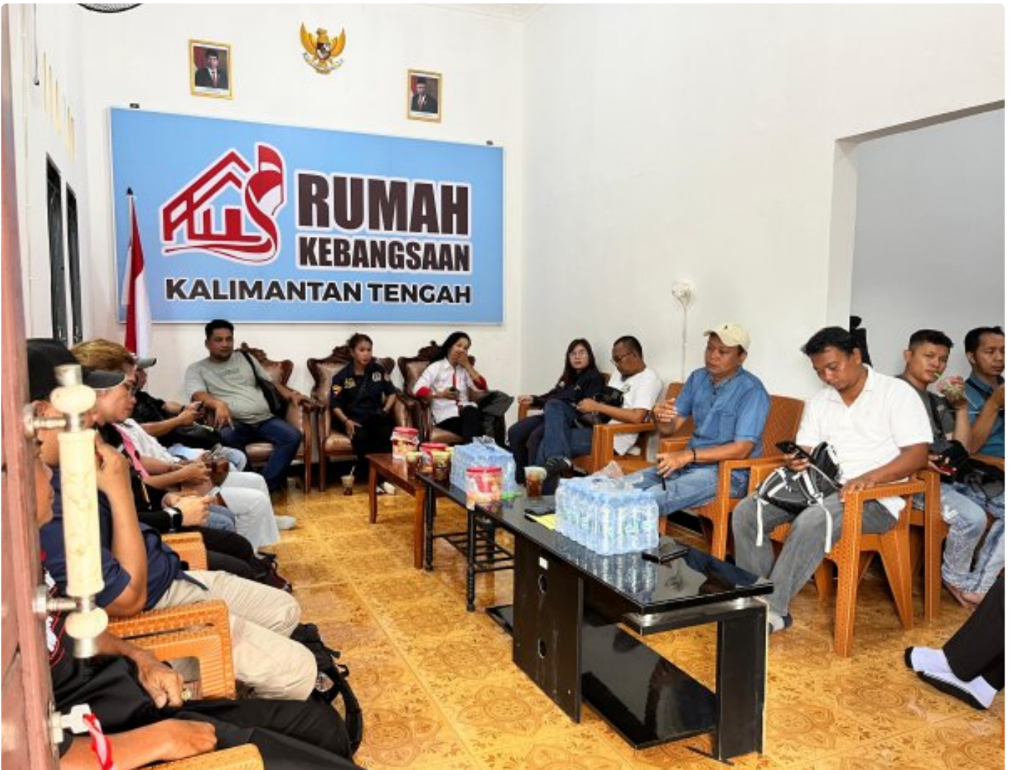
Gambar: Acara Ramah Tamah di Rumah Kebangsaan Kalteng

PALANGKA RAYA - Pelaksanaan pemilihan kepala daerah (Pilkada) yang akan dilaksanakan secara serentak di seluruh wilayah Republik Indonesia, tahun 2024 ini.